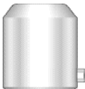
Matriz Torreta Alta est. A previa.

Con esta ampliación del rango de medidas, los clientes observarán un ángulo más pronunciado en el chaflán superior de la matriz (ver dibujo). Esto permitirá una mayor area en la parte superior de la matriz para poder aceptar la ampliación del rango de medidas.